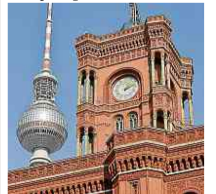
Die Zeit ist stehen geblieben auf der Uhr am Roten Rathaus.