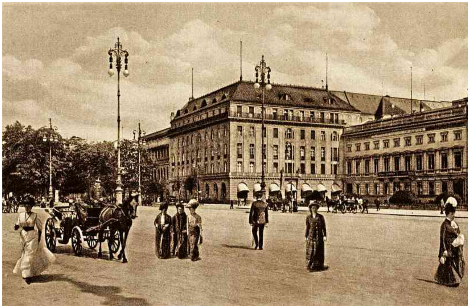
Berlin in der Kaiserzeit: 1907 eröffnete der Hotelier Lorenz Adlon sein Hotel am Boulevard Unter den Linden. In dem luxuriösen Prachtbau weilte weltweite Prominenz.

Klare Worte an der Restaurant-Pforte: Sie werden nur zeitweise platziert.